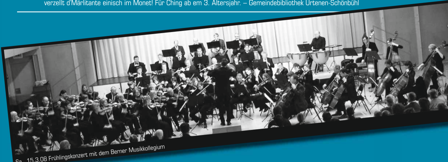
Sa., 15.3.08 Frühlingskonzert mit dem Berner Musikkollegium

verzellt d'Märliante einisch im Monet! Für Ching ab em 3. Altersjahr. – Gemeindebibliothek Urtenen-Schönbühl