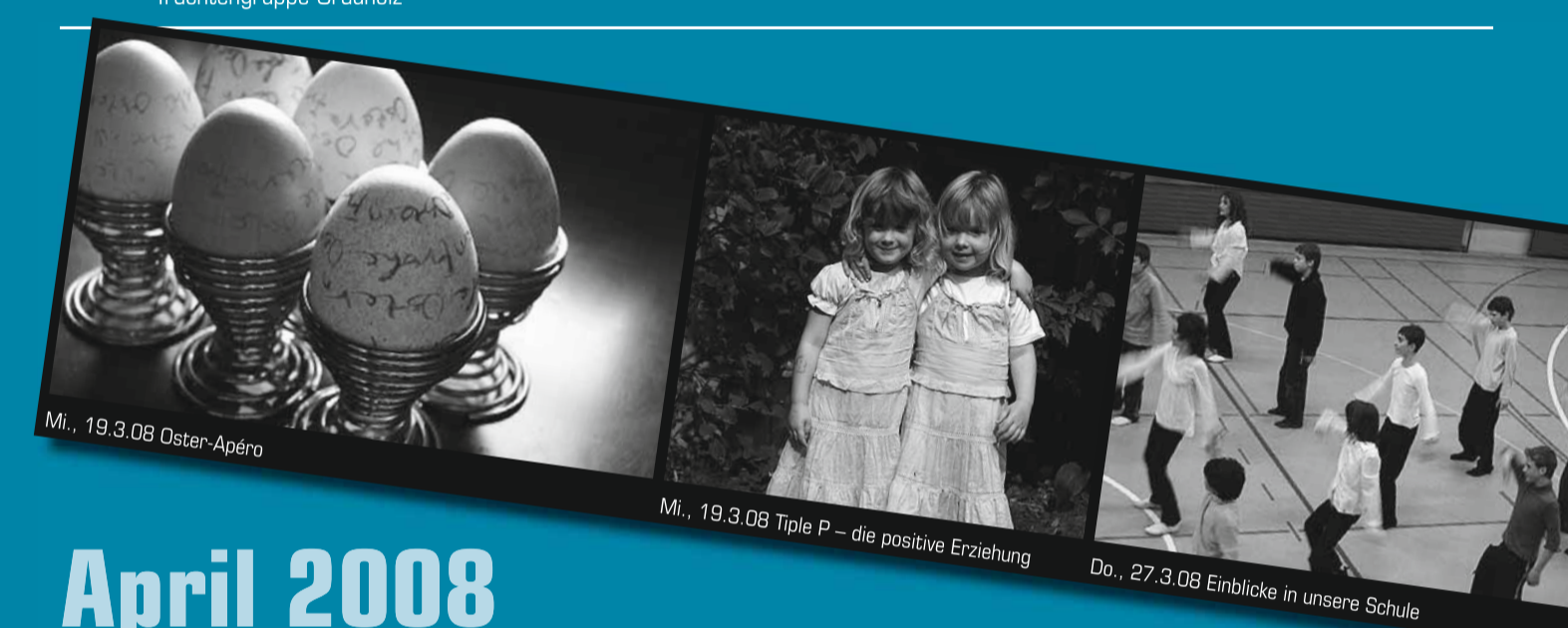
Mi., 19.3.08 Oster-Apéro

Samstag: Jodelquartett Sichleblick Eriz, Volkstänze und Theater: Tanzmusik: Schwyzerörgeli-quartett «Nume Hüt», Speis und Trank. Trachtengruppe Grauholz