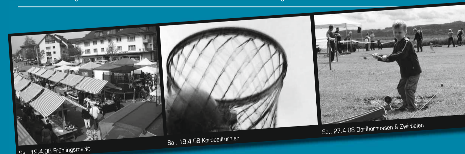
Sa., 19.4.08 Frühlingsmarkt

Die Musikgesellschaft freut sich auf Ihren Besuch an unserem Konzert. – Musikgesellschaft Urtenen-Schönbühl