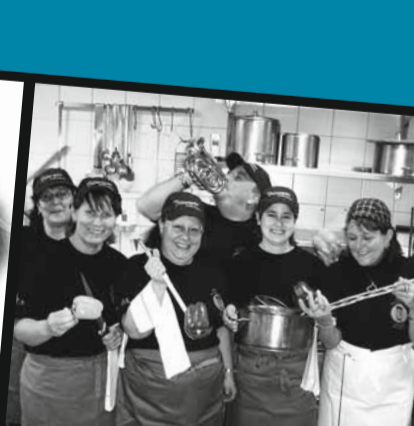
Fr., 29.2.08 «Dienstags bei Morrie» – Theater 58