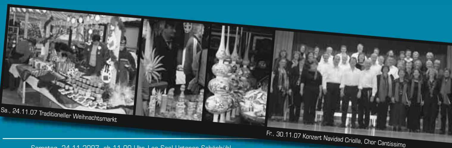
Sa., 24.11.07 Traditioneller Weihnachtsmarkt

Geschenke und Adventsdekorationen vom Weihnachtsmarkt! Marktstände mit verlockenden Angeboten. Nützliches und Schönes fürs ganze Jahr. Samichlous und sein Eseli. Ein Glasbläser zeigt seine alte Kunst... Kaffee, Glühwein, Kuchen, Marroni, IG-Beizli... Und sich treffen, reden, scherzen! – U-Schön Ortsmarketing