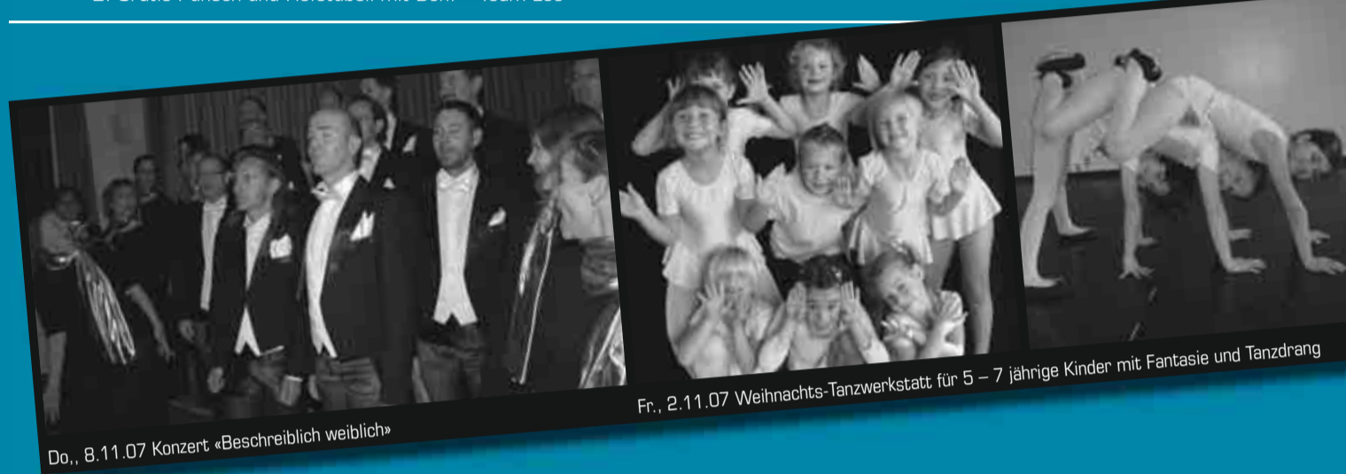
Do., 8.11.07 Konzert «Beschreiblich weiblich»

Verkauf von Räben und Hefetübeli-Bon auf dem Zentrumsplatz bei der Gemeinde: Montag, 5.11.07 14.30 – 16.00 Uhr sowie Dienstag, 6.11.07, 10.00 – 11.00 Uhr. Route Umzug: Lee 2 – Staldenstrasse – Lindhohleweg – Oberdorfstrasse – Staldenstrasse – Lee 2. Gratis Punsch und Hefetübeli mit Bon. – Team Lee