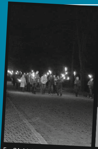
Fr., 21.11.08 Fackelmarsch

Jeder Gang auf volle Karte. Organisation und Ablauf wieder in eigener Regie. FC Schönbühl