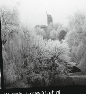
Winter in Urtenen-Schönbühl