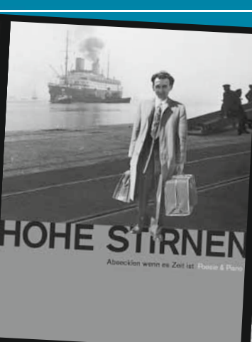
Mi., 12.11.08 Absecken wenn es Zeit ist