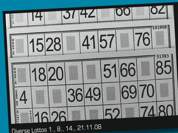
Diverse Lottos 1., 8., 14., 21.11.08

Möchten Sie diese chinesische Bewegungs-Meditationstechnik kennen lernen? Schauen Sie herein und machen Sie mit! Sie werden fasziniert sein von diesen harmonisierenden, ruhigen und sanften Bewegungen. Infos: Dino Rigoli 031 352 71 06, www.dinorigoli.ch Verein für Tanz und Bewegung