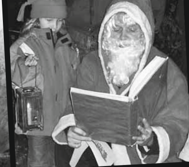
Sa., 6.12.08 Dr Samichlous chunt!