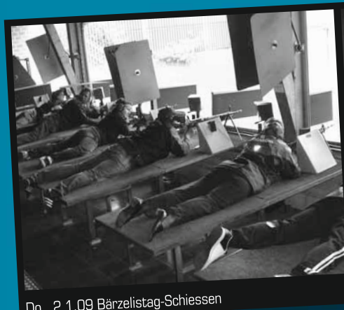
Do., 2.1.09 Bärzelistag-Schiessen

Waldspaziergang mit Fondueplausch. Nähere Angaben folgen im Dezember. Bitte Homepage der Gemeinde, Schaukästen und Flyer beachten. 3322.bewegt/Verein U-Schön