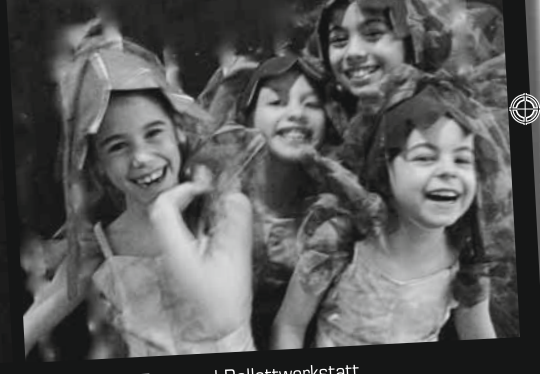
Fr., 7.11.08 Tanz- und Ballettwerkstatt

Mittwoch, 12.11.2008, 20.00 Uhr, Kirchgemeindehaus Moosseedorf