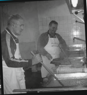
Sa., 22.11.08 Erbs-Suppentag