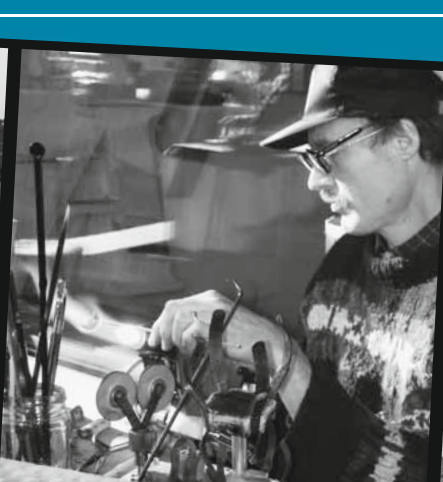
Sa., 22.11.08 Traditioneller Weihnachtsmarkt