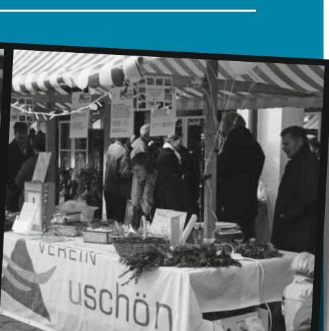
Sa., 22.11.08 Traditioneller Weihnachtsmarkt

Freitag, 21.11.2008, 18.00 – 20.00 Uhr, Besammlung 18.00 Uhr beim Lichthof (neben Lee-Saal) Schulanlage Urtenen-Schönbühl