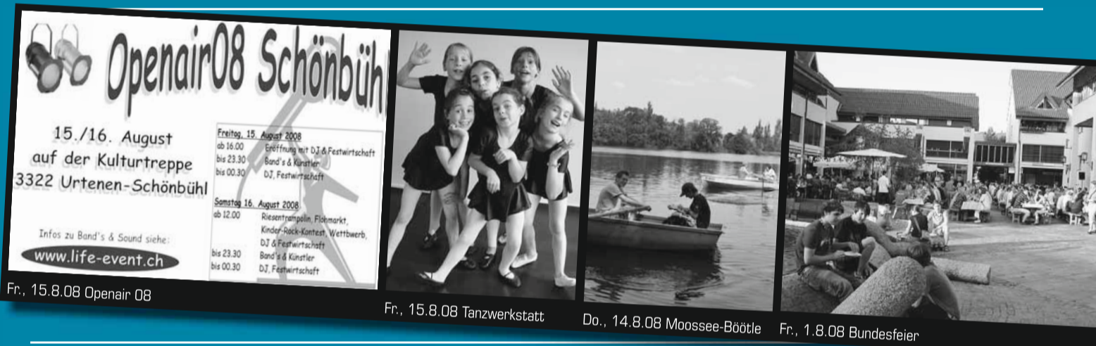
Fr., 15.8.08 Openair 08

Mit Ruderboot (keine Mietgebühr) auf dem Moossee die Abendstimmung geniessen. Restaurant Seerose ist geöffnet. 3322.bewegt/Verein U-Schön