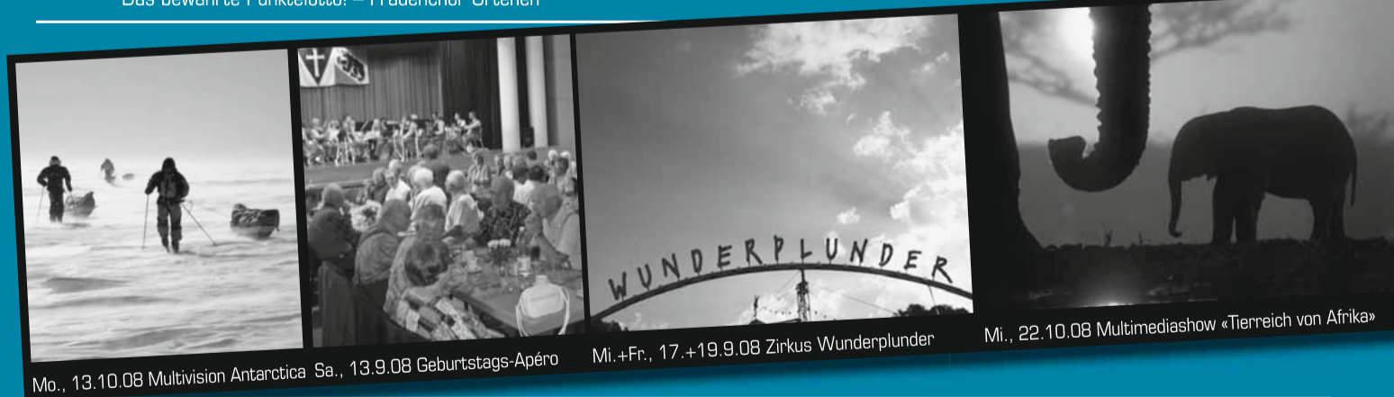
Mo., 13.10.08 Multivision Antarctica

Das bewährte Punktelotto! – Frauenchor Urtenen