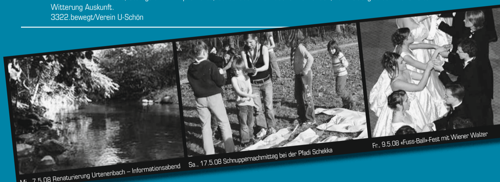
Mi., 7.5.08 Renaturierung Urtenenbach – Informationsabend

Skore-OL (60 Min. Zeit zur Verfügung, möglichst viele der 30 Posten werden nach freier Reihenfolge angelaufen), 6 Kategorien, Einzel- oder Team-Start, Startgeld Fr. 2.– pro Karte, Garderoben und Duschen vorhanden, Tel. 1600 gibt bei zweifelhafter Witterung Auskunft. 3322.bewegt/Verein U-Schön