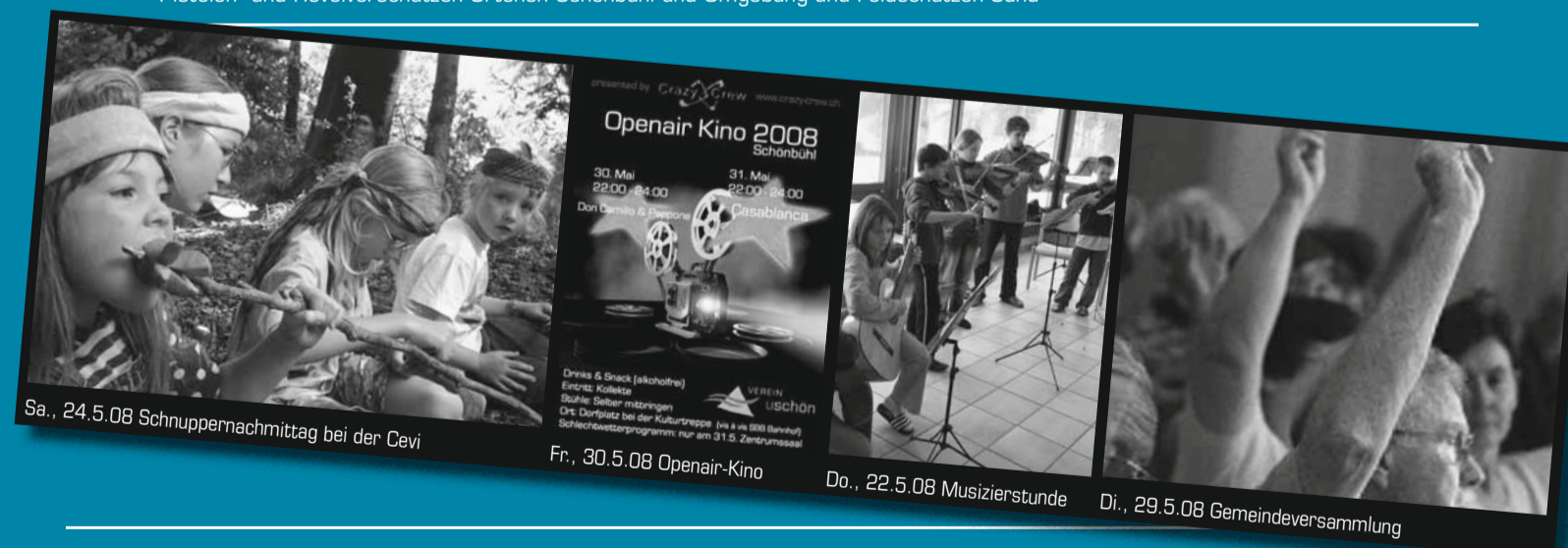
Sa., 24.5.08 Schnuppernachmittag bei der Cevi

Vorschiessen: Donnerstag 15. Mai 08 17.00 – 20.00 Uhr. Ausstich der Besten von Freitag und Samstag am Samstagabend um 19.30 Uhr. Pistolen- und Revolverschützen Urtenen-Schönbühl und Umgebung und Feldschützen Sand